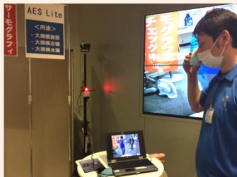
赤色灯による自動告知